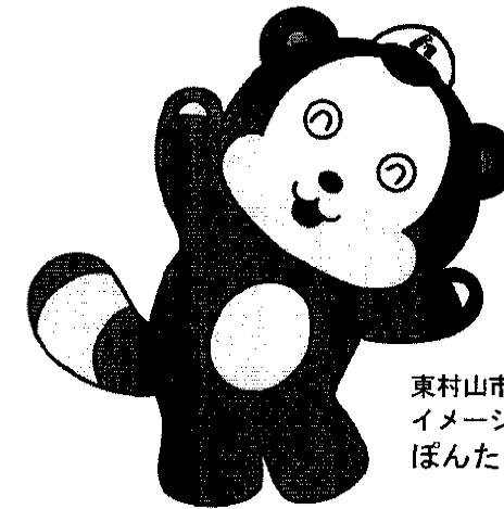
東村山市社会福祉協議会 イメージキャラクター ぼんたくん

●このワークブックは、町ごとのネットワークなどで住民活動を進める時に使ってください。 <例えば> ☆第4次計画の内容を参考にして自分の町の課題をみんなで考え、結果を書き込む ☆地域懇談会などの話し合いで、自分が感じたことをメモする ☆自分の町の情報を記録して、地区活動計画づくりに役立てる など